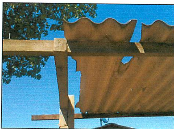
Rua Araraquara, esquina com Rua Europa - Bairro Morumbi