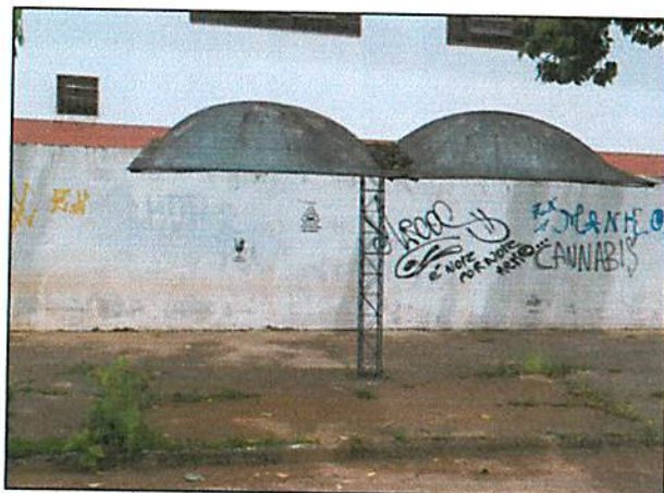
Rua Londrina, esquina com Barão do Rio Branco - Bairro São Cristóvão