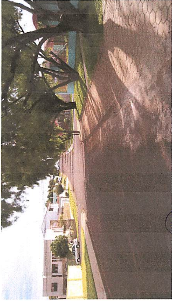
Risto Bravco - IDENTIFICA ESCOLAS E FAZIDA.