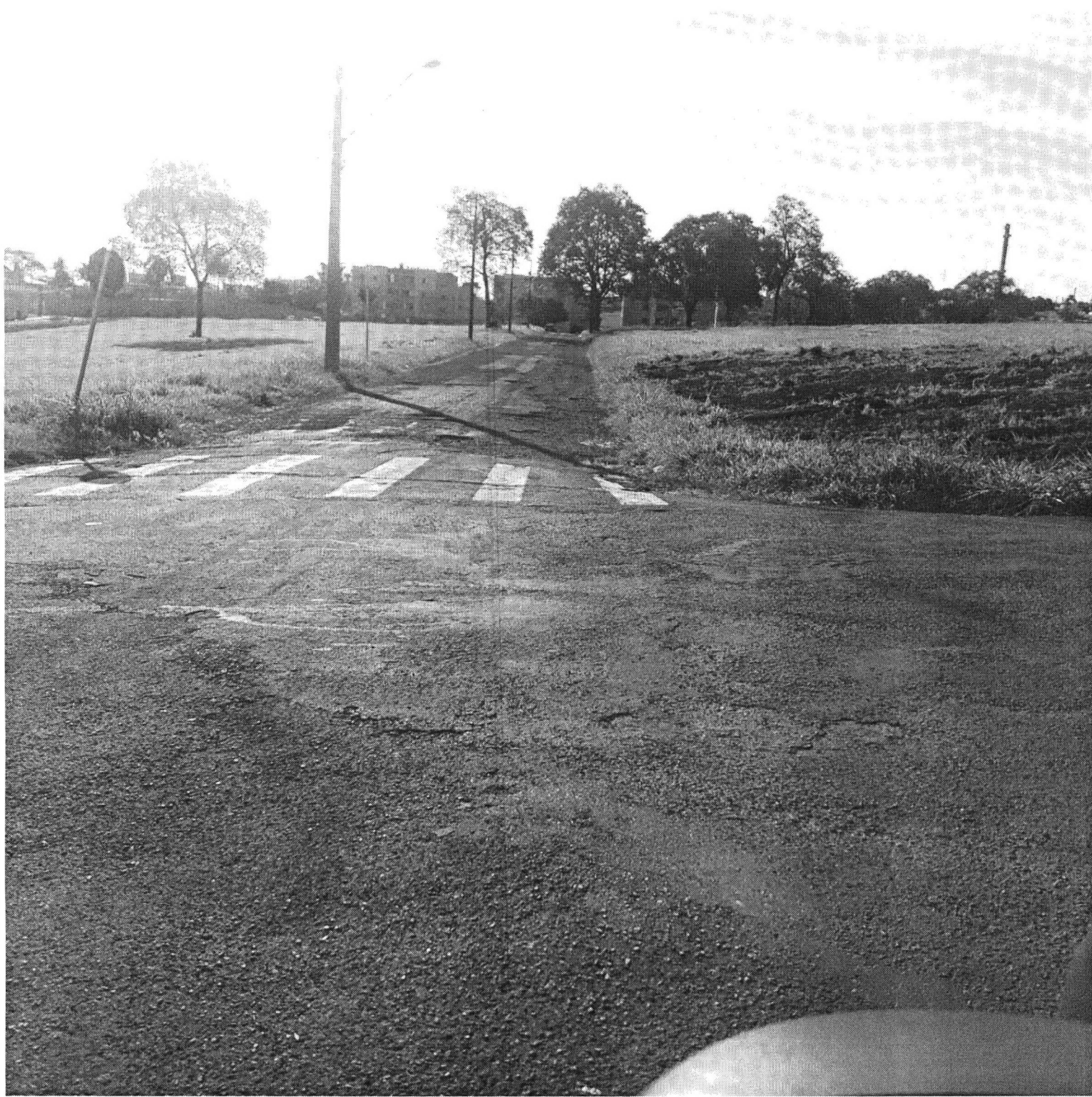
RUS ACRE / ARTUR NIZIO (COUNTRY) COUNTRY