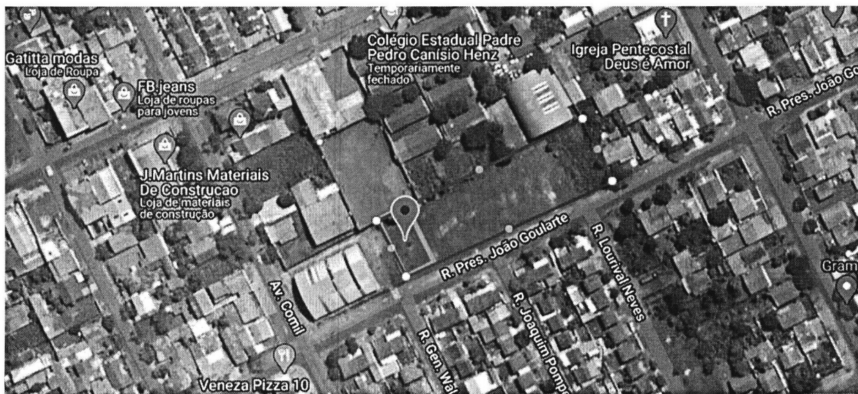
Figura 1. Imagem aérea da área a ser doada à COHAVEL. Lotes nº 2A, 2B, 2C, 2D, 2E, 2F e 2G, da Quadra 21-A, do Loteamento Jardim Veneza.

Os imóveis a serem doados são os seguintes: Loteamento Jardim Veneza, Quadra 21-A, Lotes nº 2A, 2B, 2C, 2D, 2E, 2F e 2G.