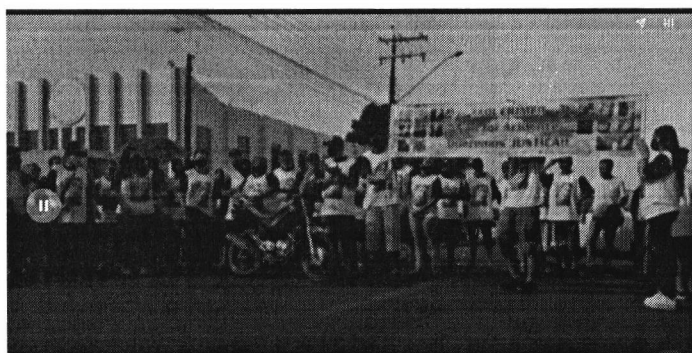
Protesto família jovem morto em acidente de cruzamento

OBSERVAÇÃO: POPULAÇÃO PEDE IMPLANTAÇÃO DE UM SEMÁFARO NO CRUZAMENTO. NÃO SENDO POSSÍVEL VER A POSSIBILIDADE DA IMPLANTAÇÃO D'UMA ROTATÓRIA.