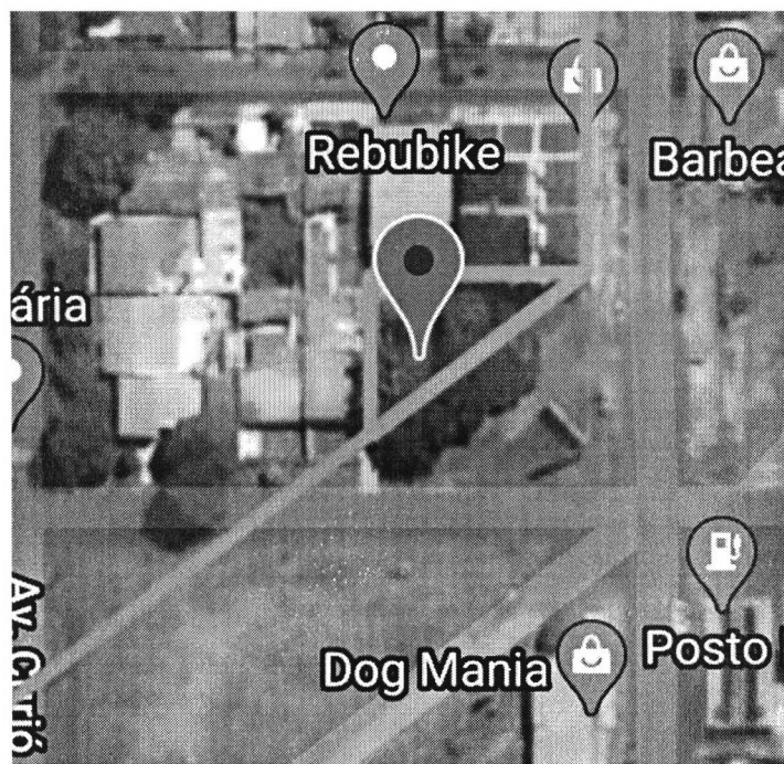
Figura 1. Lote UP-10, da Quadra nº 76, do Loteamento Parque Habitacional Floresta, com área de 444,23 m 2 , de propriedade do Município de Cascavel.

Os imóveis objetos da permuta em questão são os seguintes: