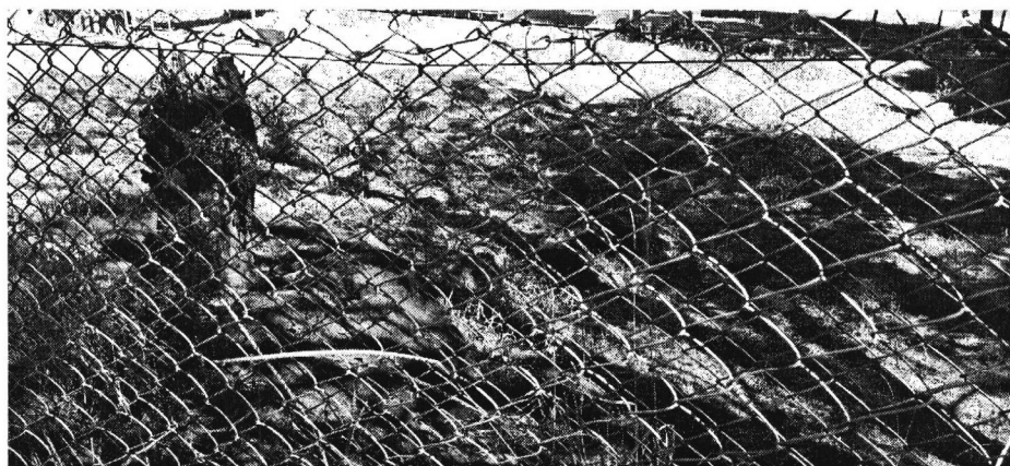
Formigas estão causando erosões no solo por baixo da grama sintética