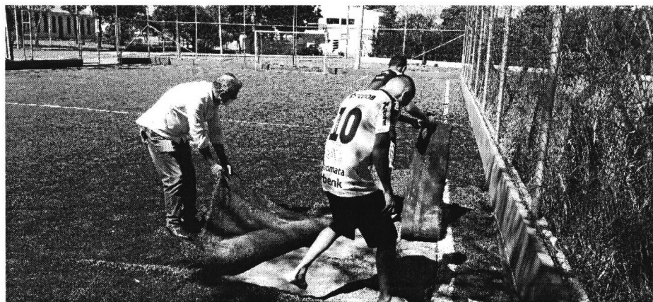
Grama sintética está descolando