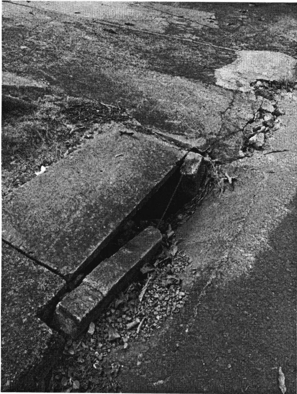
LOTEAMENTO JERONA, SUA MEDICINA EM FRENTE Nº 791