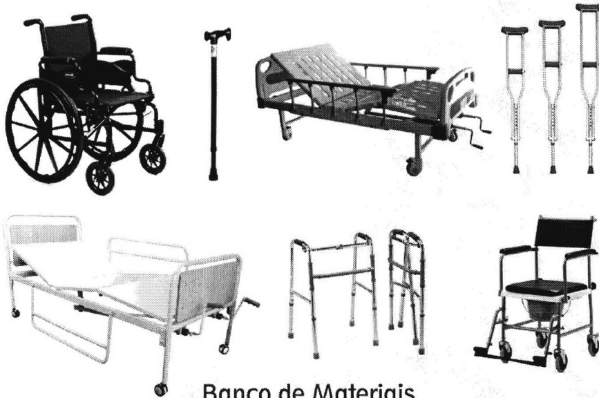
Banco de Materiais ORTOPÉDICOS