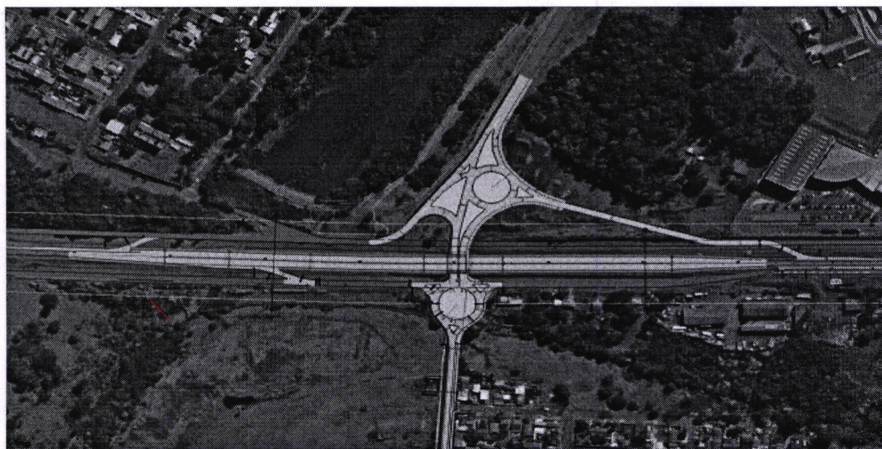
Figura 4: Detalhe do Projeto do Viaduto/Trincheira.

A obra contempla a implantação de viaduto/trincheira com aproximadamente 950 metros de extensão, incluindo quatro faixas de rolamento, ciclovia, passeio para pedestres, pavimentação e alargamento da rua Munique, além da instalação de sistemas de contenção destinados a evitar impactos ambientais no manancial do Rio Cascavel. Segue anexada imagem do projeto.