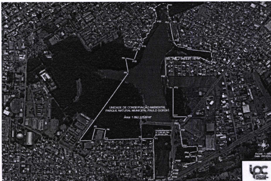
Figura 6: Delimitação da Unidade de Conservação Ambiental Parque Natural Municipal Paulo Gorski após retirada de área para a construção do viaduto e incorporação de áreas adjacentes.

Com a intervenção passará a ter 1.093.225,07 m 2 , conforme imagem abaixo: