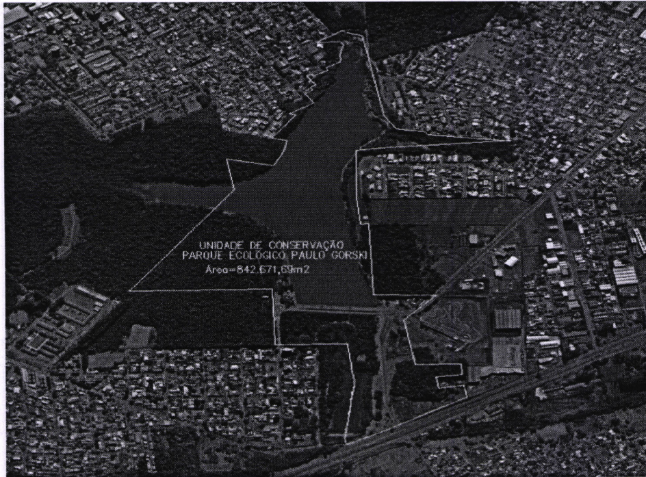
Figura 2: Mapa da Delimitação atual da Unidade de Conservação Ambiental Parque Natural Municipal Paulo Gorski.

Com a intervenção passará a ter 1.093.225,07 m 2 , conforme imagem abaixo: